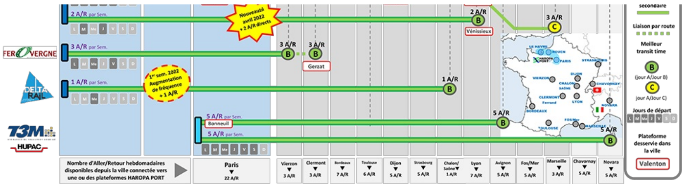
La desserte de l'hinterland par voie ferroviaire ↗