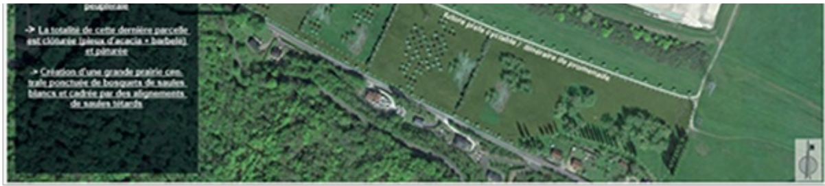
Projet de restauration paysagère (vue du site en 2016 et vue en fin de projet)