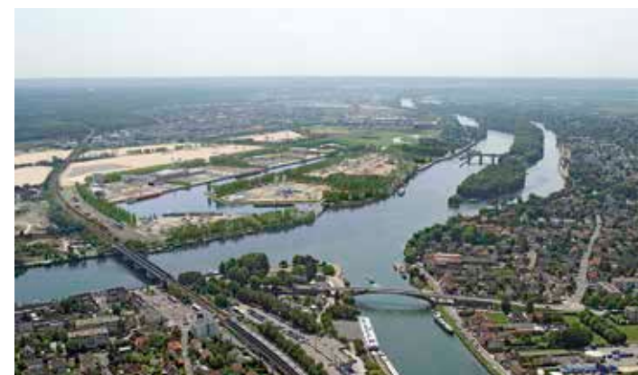
Le projet à l'issue de la Phase 4