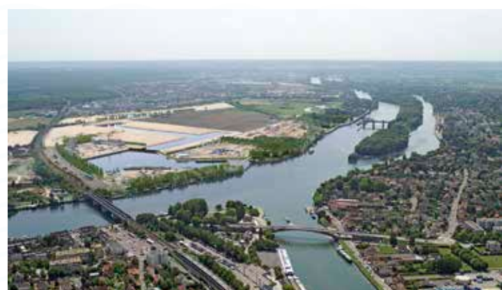
Le projet à l'issue de la Phase 1