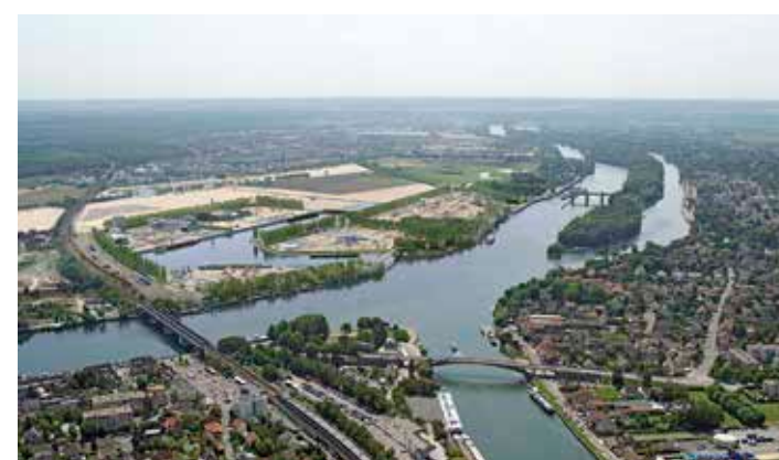
Le projet à l'issue de la Phase 2