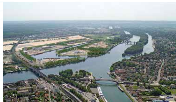
Le projet à l'issue de la Phase 3