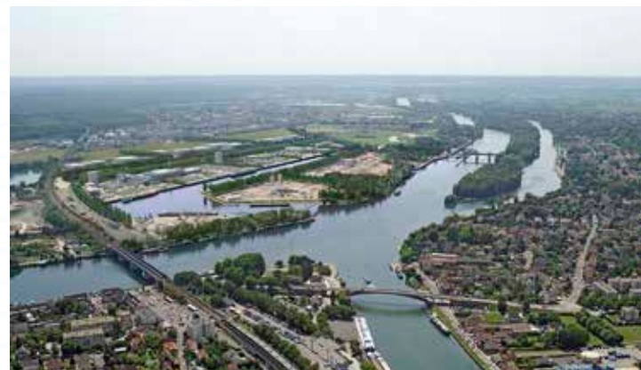
Le projet à l'issue de la Phase 5

Informez-vous sur Port Seine-Métropole Ouest