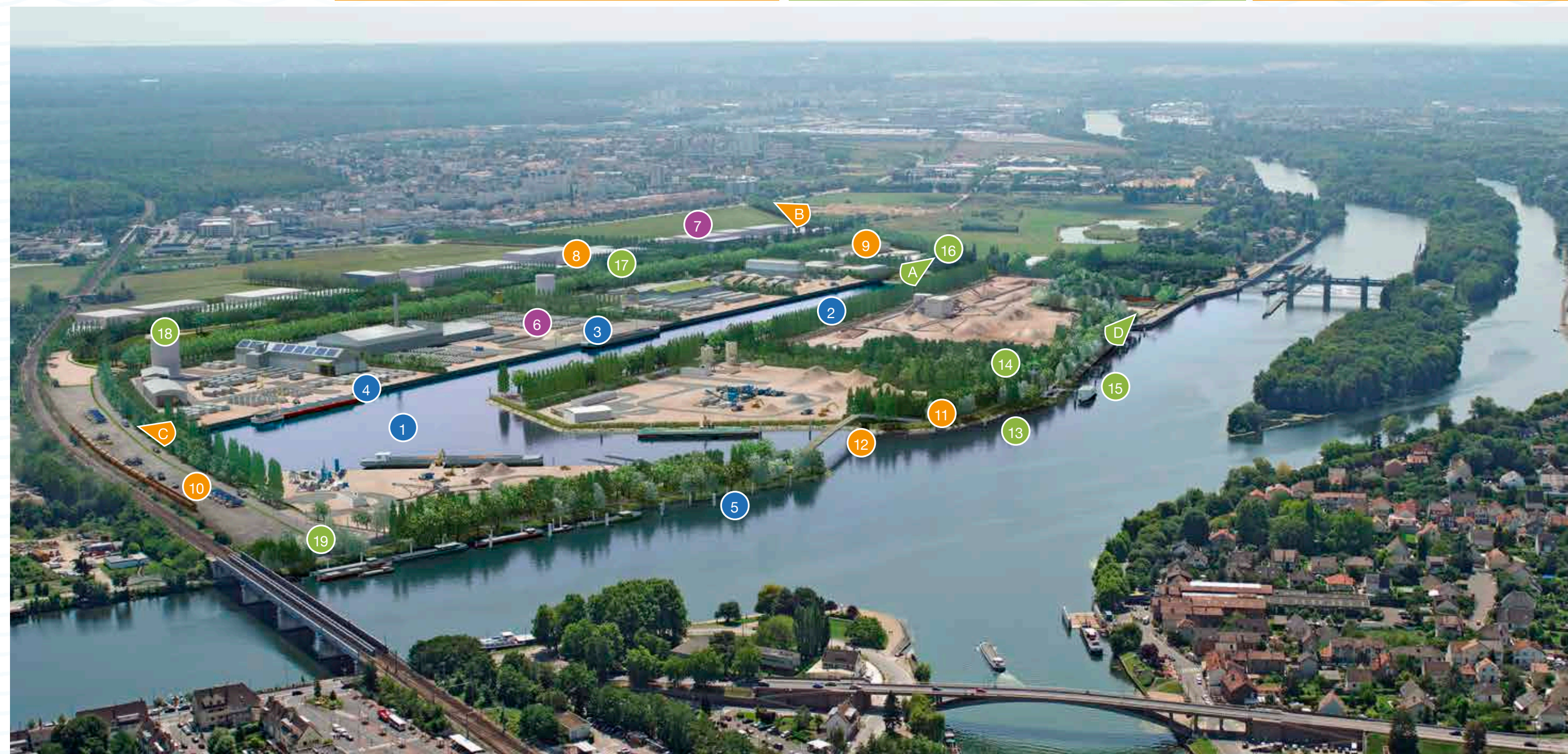
Perspective du projet PSMO en 2040 (fin de la phase 5) : un port intégré dans le territoire de la Confluence.