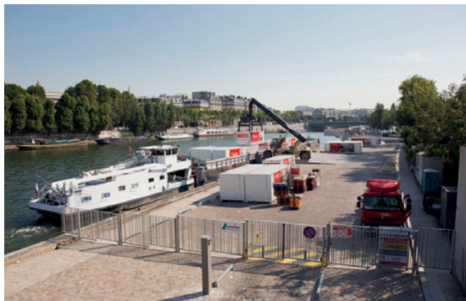
Assurer les continuités piétonnes