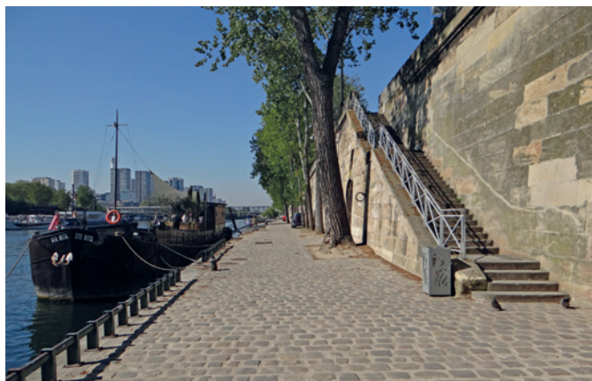
Améliorer l'accessibilité pour tous