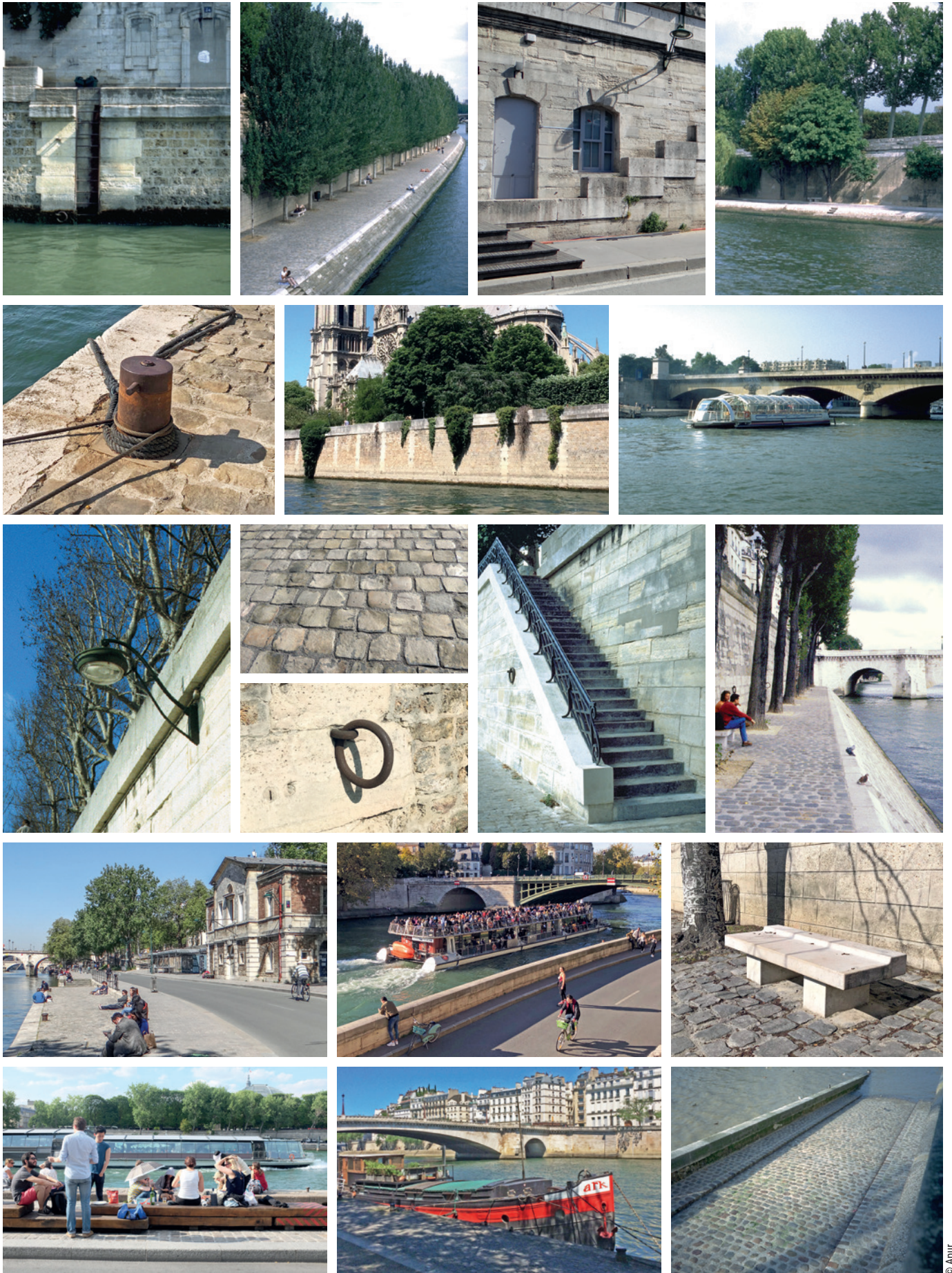
De haut en bas et de gauche à droite : échelle de quai • quai sur perré • locaux dans le mur de fond de quai • végétalisation étagée • bollard • mur de quai haut harpé • bateau de transport de passagers • luminaire sur mur de fond de quai • pavés de grès • anneau d'amarrage • escalier quai haut/quai bas • berges étroites • pavillon des Célestins • bateau de croisières commentées • banc berges de Seine • animation des berges • bateaux logement • rampes de mise à l'eau.