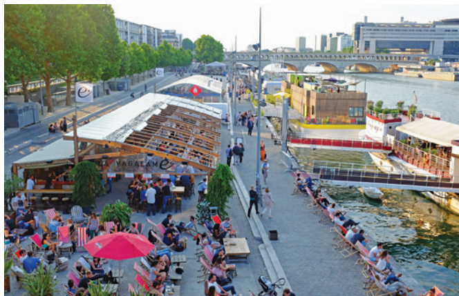
Prendre en compte les évolutions des installations saisonnières