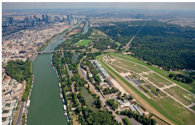
Intégrer les berges du bois de Boulogne