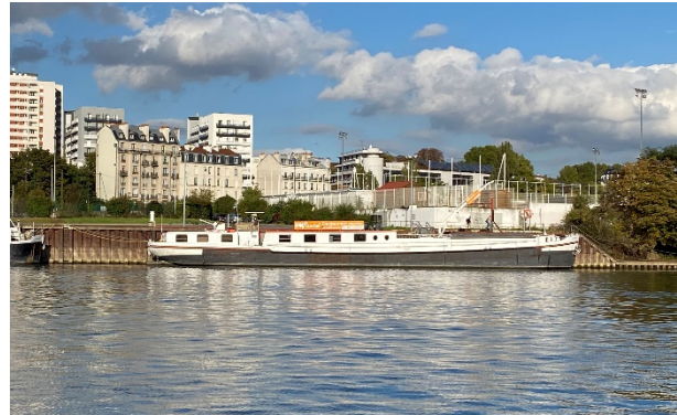
Emplacement du bateau «FEMMY », 09-10-2020

L'emprise globale plan d'eau et terre-plein est située en site protégé au titre des sites et des abords des Monuments Historiques soit aux abords de bâtiment classé MH (pavillon Antoine de Navarre).