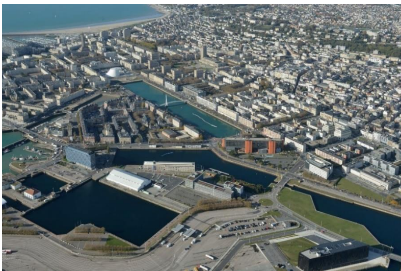
Le quartier de la Citadelle accueille le terminal ferry, l'Ecole supérieure de la marine marchande, le bâtiment administratif de HAROPA PORT | Le Havre et plusieurs de ses ateliers techniques

Le ministère de la Culture et de la Communication organise les 39 e Journées européennes du patrimoine les samedi 17 et dimanche 18 septembre. Le thème de l'édition 2022 est « patrimoine durable » et permet de découvrir ou redécouvrir le patrimoine des régions et de mieux en comprendre l'histoire et les spécificités. HAROPA PORT propose plusieurs visites-découvertes à Paris, Rouen et au Havre autour de du patrimoine portuaire sous l'angle de son ancrage territorial et de sa résilience.