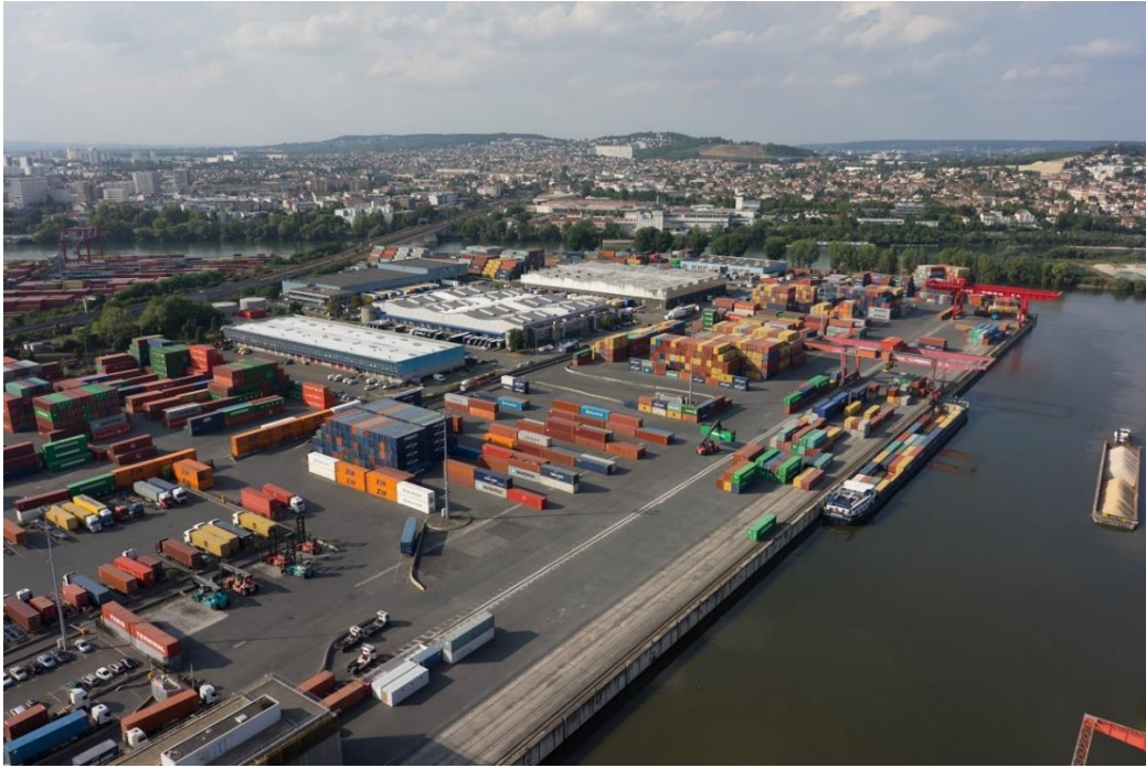
Le port de Gennevilliers est la première plate-forme fluviale de France