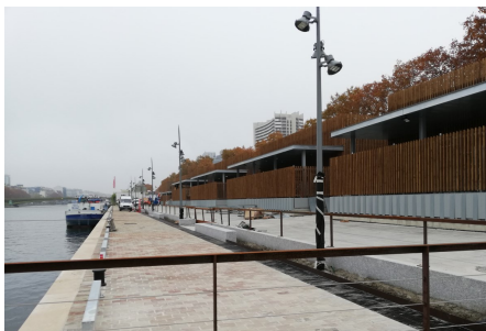
Bord à quai après travaux

Ces interventions sur la voirie résultent de multiples recommandations incluant les documents de planification (PLU), la protection du patrimoine (ABF) ou encore la proximité de la voie SNCF.