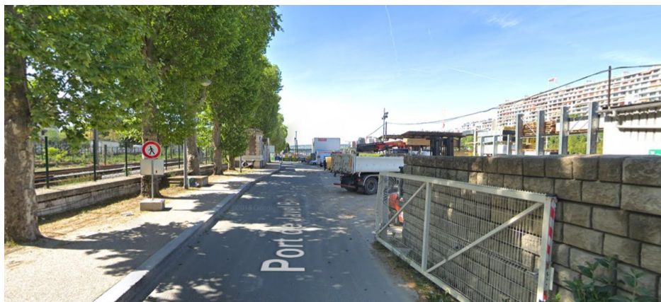
Avant les travaux de réaménagement