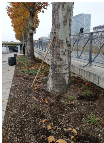
Aménagement d'une bande plantée en fond de quai.