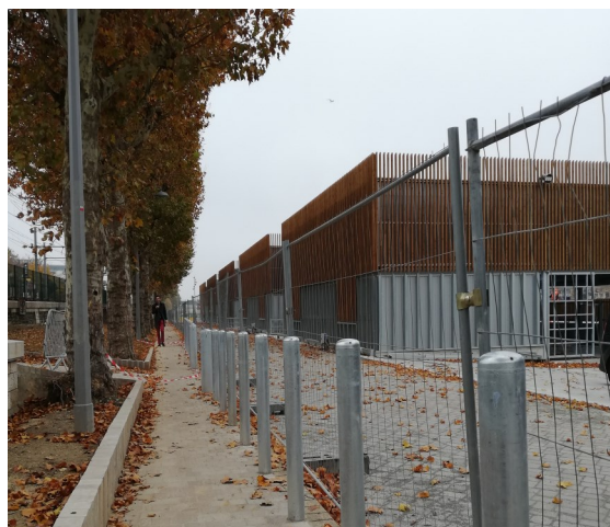
Sécurisation des circulations avec un alignement de plots séparant la voie piétonne du circuit logistique.