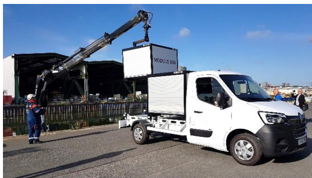
L'utilitaire Renault Master Modulo-box

« Depuis des années, la division utilitaire du Renault Group développe des solutions innovantes de mobilité pour relever les défis auxquels les professionnels sont confrontés. Nous explorons aujourd'hui une solution intermodale qui s'appuie sur des caisses modulaires : les Modulo-box. On peut les poser et les enlever facilement sur différents types de porteurs, qui vont des petites utilitaires aux camions, grâce à l'ingénieux système de fixation QuickLock. Cette solution est applicable à d'autres véhicules avec des caisses de dimensions différentes, elle est aussi ouverte à la transmodalité avec la logistique fluviale », explique Taku Kamoshida , chef de projet Stratégie Véhicules Utilitaires, Renault Group.