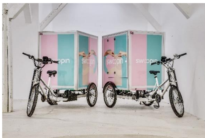
Les vélos-cargos Swoopin