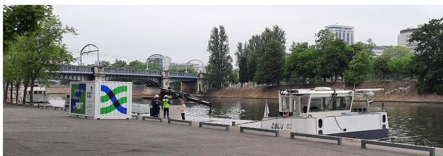
La barge Zulu de Blue Line Logistics

solutions adaptées à la nature de chaque déplacement fret ou transport de personnes ; distances à parcourir ; destination finale (périphérie ou cœur de ville). Le fluvial, longtemps utilisé pour transporter le vrac et gros volumes, souhaite apporter une réponse modernisée et vertueuse au transport et à la livraison de marchandises de qualité à destination des centres villes. Grâce à un bateau conçu spécifiquement (gabarit, capacité fret, motorisation) Blue Line Logistics France apporte une solution innovante et compétitive à la livraison du dernier kilomètre », déclare Gilles Peyrot , chargé du développement multimodal, Sogestran.