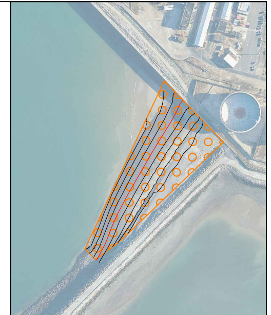
Zone "Plage extérieure de galets"